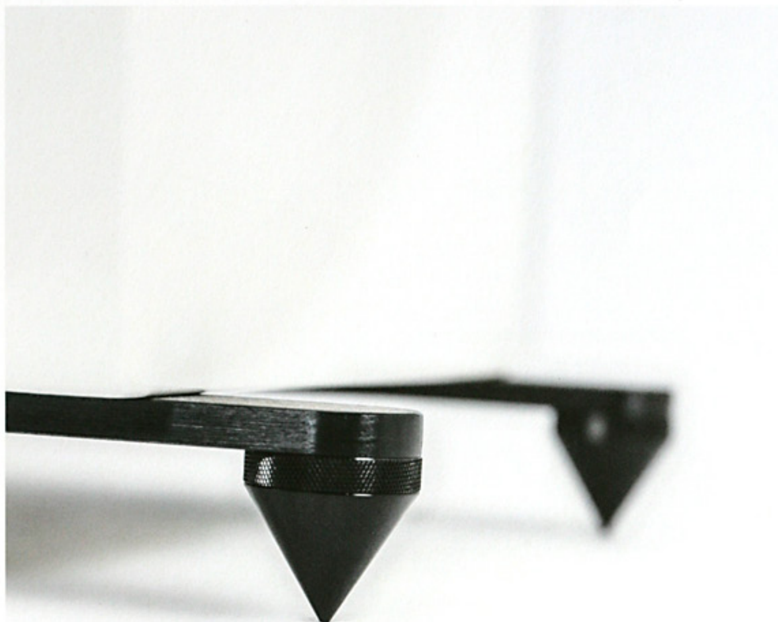
Auslegungssache? Keineswegs. Die höhenverstellbaren Spikes in den massiven Auskragungen verbessern Stand und Klang der Veritas p10 Next deutlich.