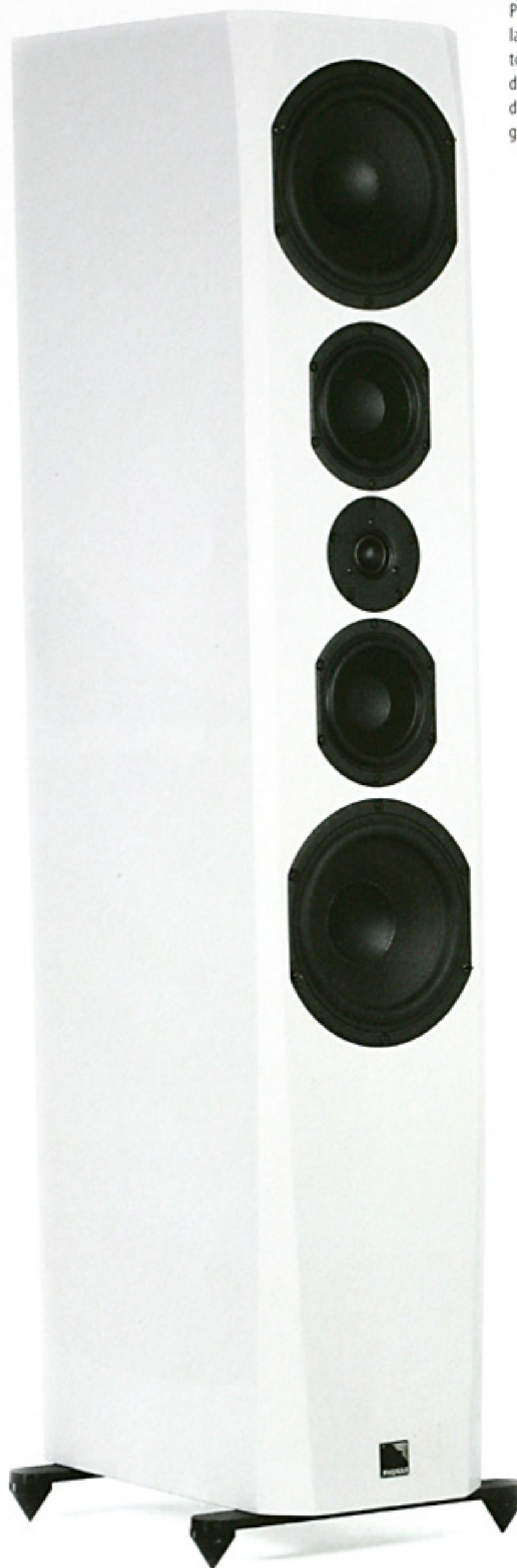
Punktschallquellen-Simulation durch d'Appolito-Anordnung der Chassis, dezente Laufzeitkorrektur durch sanfte Rückwärtsneigung des Gehäuses

Wer die Phonar Veritas p10 Next ausgiebig gehört hat, könnte durchaus zum Fan werden, denn dieser Schallwandler folgt jener Definition von Vollkommenheit, die einst der Autor des Kleinen Prinzen , Antoine de Saint-Exupéry, so formuliert hat: „Perfektion entsteht offensichtlich nicht dann, wenn man nichts mehr hinzuzufügen hat, sondern wenn man nichts mehr wegnehmen kann. Am Ende ihrer Entwicklung ist die Maschine nicht mehr wahrnehmbar.“ Ein eigentlich auf die Fliegerei bezogener Aphorismus, der gleichwohl auch auf highendige Wiedergabegeräte anwendbar ist. Tendiert ein wirklich guter Lautsprecher doch tatsächlich dazu, sich unsichtbar zu machen, im besten Fall sogar die Hörraumwände zu